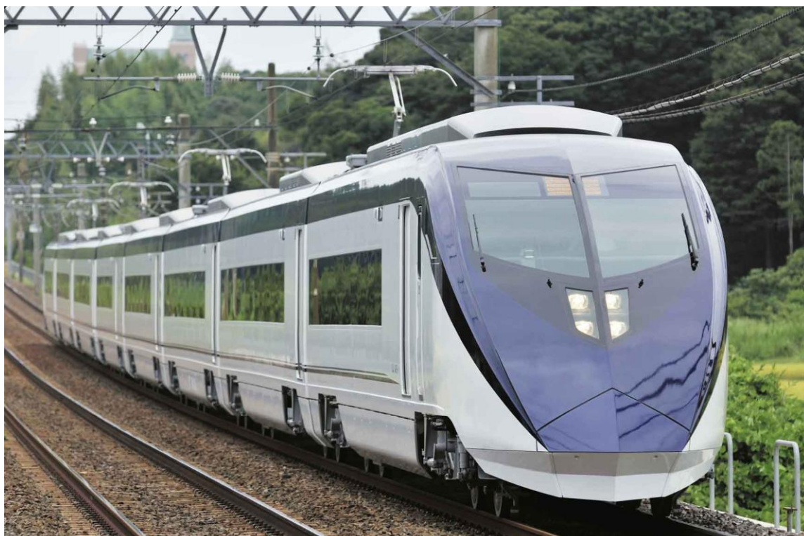
終夜運転で「シティライナー」として運行する新型スカイライナー車両（AE形）

さらに、平成22年12月30日（木）～平成23年1月3日（月）までの5日間、終夜運転及び増発列車以外のダイヤについては、土曜・休日ダイヤで運転します。