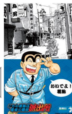
「両さん」ラッピング列車イメージ図