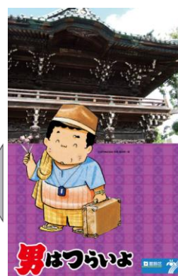
「寅さん」ラッピング列車イメージ図