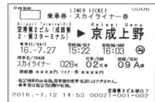
スカイライナー 乗車券・特急券 (イメージ)