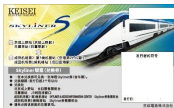
写真左：スカイライナー、写真右上：Keisei Skyliner & Tokyo Subway Ticket (引換券) イメージ 写真右下：スカイライナークーポン (引換券) イメージ