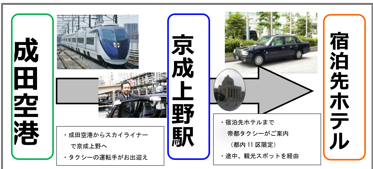
「KEISEI SKYLINER & TEITO TAXI」イメージ

京成グループでは今後も、グループシナジーを発揮し、訪日外国人のお客様に、日本でのご旅行をより便利で快適に、そして安心してお楽しみいただけるよう努めて参ります。