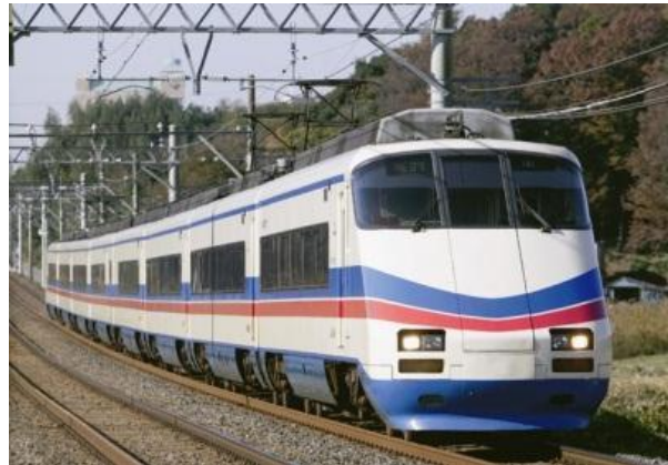
写真左：大晦日終夜運転で「シティライナー」として運転する新型スカイライナー車両(AE形) 写真右：1月中の土曜・休日ダイヤ実施日に「シティライナー」として運転するAE100形

大晦日終夜運転は、成田山新勝寺や柴又帝釈天など沿線の初詣にご利用いただくことを目的として実施するもので、上野～成田、高砂～金町、高砂～押上～都営浅草線の各区间で、約20分～50分間隔で運行するほか、上野～成田間で途中、日暮里・青砥・船橋に停車する「シティライナー」を、新型スカイライナー車両(AE形)を使用して上下各1本運転します。