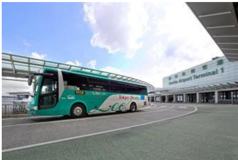
『東京シャトル (Tokyo Shuttle)』の運行車両

「粋割」とは、東京都心（東京駅・東雲車庫・銀座駅・大江戸温泉物語）から成田空港「行き」にご乗車いただくお客様に『東京シャトル (Tokyo Shuttle)』を今まで以上にご利用いただきやすいものとするために実施するものです。