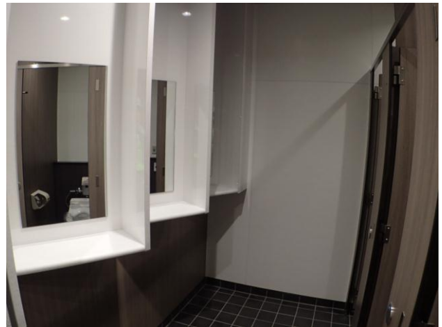
▲ 女性トイレ（パウダーコーナー）