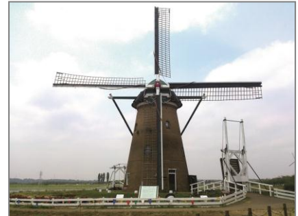
佐倉ふるさと広場

本イベントは、ウォーキングを楽しみながら、沿線の見どころや地域の魅力を再発見していただくことを目的として開催し、今回で通算10回目になります。千葉県東葛地域を走る鉄道4社の合同イベントのため、日頃ご利用いただいている鉄道路線以外の新たな街へ一足伸ばせる機会として大変好評をいただいております。