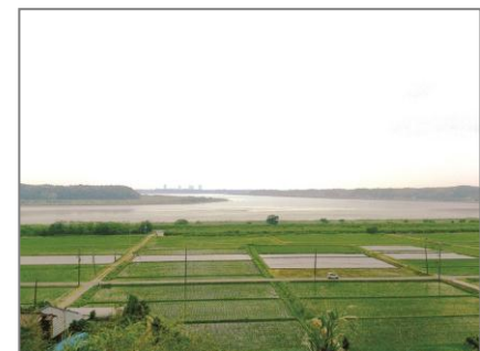
徳性院から見た印旛沼

ご参加いただき完歩された方には、先着4,000名様に「4社合同ウォークオリジナルバッジ」をプレゼントします。事前申し込みは不要、参加人数にも制限はございませんので、お気軽にご参加いただけます。残暑も終わり、秋風が薫る初秋のウォーキングをぜひお楽しみください。皆さまのご参加をお待ちしています。