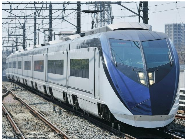
上り最終列車の発着時間が繰下がるスカイライナー