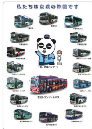
小学校高学年用下敷き