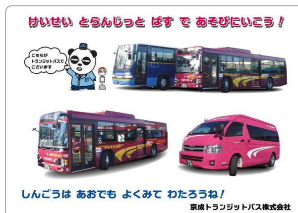
小学校低学年用下敷き