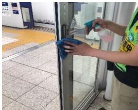
待合室の消毒作業

駅構内及び鉄道車両の消毒については、定期に加え必要に応じて実施しています。なお、お客様が手を触れる箇所(券売機、エレベータ内、お手洗い、手すり、つり革、座席等)を中心に、抗菌・抗ウイルス加工を実施しています。一般車両では係員による窓上部の開閉、スカイライナー車両(イブニングライナー・モーニングライナー含む)では換気装置により、車内換気を実施しています。