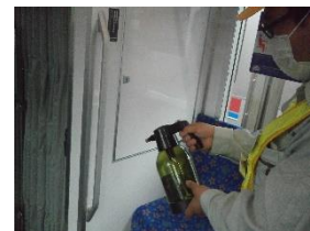
手すりの消毒作業 (一般車両)

お客様におかれましても、手洗い・うがい・咳エチケットのほか、時差出勤など混雑時間帯を避けたご乗車や、車内換気のため天候や混雑状況に応じた窓上部の開閉等へのご協力、また、可能な限り、マスクの着用と会話の際の周囲へのご配慮をお願い申し上げます。