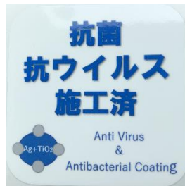
「抗菌・抗ウイルス施工済」ステッカー (鉄道車両内に掲示)