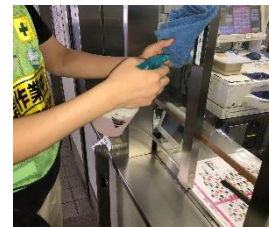
駅構内の消毒作業