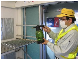
車内荷物置き場の消毒作業 (スカイライナー)