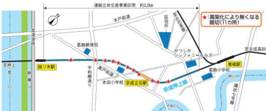
▲高架化により無くなる踏切

立体交差化に伴い、11箇所の踏切が撤去されるとともに、これまで鉄道により分断されていた市街地の一体化が図られます。さらに、側道(附属街路)・駅前広場(交通広場)などを整備することによって、沿線地域の道路の状況や生活環境が改善され、新たな魅力あるまちづくりが推進されます。