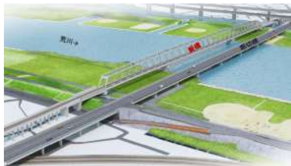
▲架替イメージ(新橋の全景)