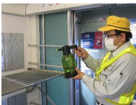
荷物置き場の消毒作業 (スカイライナー)