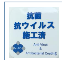
「抗菌・抗ウイルス施工済」ステッカー (鉄道車両内に掲示)

お客様におかれましても、手洗い・うがい・咳エチケットのほか、時差出勤など混雑時間帯を避けたご乗車や、車内換気のため天候や混雑状況に応じた窓上部の開閉等へのご協力、また、可能な限り、マスクの着用と会話の際の周囲へのご配慮をお願い申し上げます。