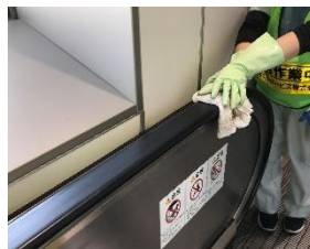
エスカレータ手すりの消毒作業