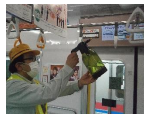
つり革への消毒作業