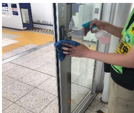
待合室の消毒作業

※職員の熱中症予防のため、お客様と近接しない事を確認したうえでマスクを着用しない場合がございます。