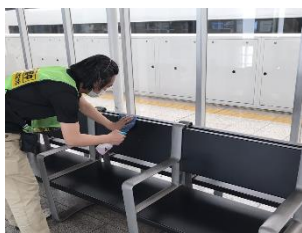
ホーム待合室の消毒作業

※職員の熱中症予防のため、お客様と近接しない事を確認したうえでマスクを着用しない場合がございます。