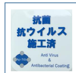
「抗菌・抗ウイルス施工済」ステッカー (鉄道車両内に掲示)

お客様におかれましても、手洗い・うがい・咳エチケットのほか、時差出勤など混雑 時間帯を避けたご乗車や、車内換気のため天候や混雑状況に応じた窓上部の開閉等へのご協力、また、可能な限り、マスクの着用と会話の際の周囲へのご配慮をお願い申し上げます。