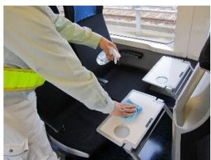
背面テーブルの消毒作業 (スカイライナー)