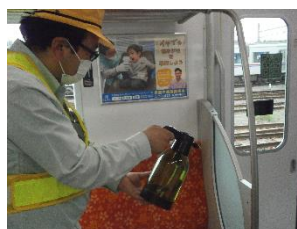
手すりの消毒作業 (一般車両)