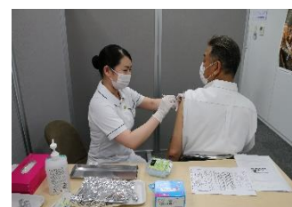
ワクチン職域接種の様子