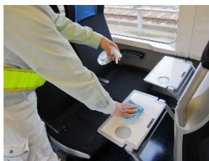
背面テーブルの消毒作業 (スカイライナー)