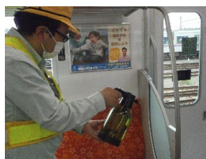
手すりの消毒作業 (一般車両)