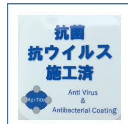
「抗菌・抗ウイルス施工済」ステッカー (鉄道車両内に掲示)

お客様におかれましても、手洗い・うがい・咳エチケットのほか、時差出勤など混雑時間帯を避けたご乗車や、車内換気のため天候や混雑状況に応じた窓上部の開閉等へのご協力、また、可能な限り、マスクの着用と会話の際の周囲へのご配慮をお願い申し上げます。