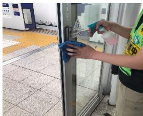
ホーム待合室の消毒作業

※職員の熱中症予防のため、お客様と近接しない事を確認したうえでマスクを着用しない場合がございます。