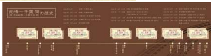
記念乗車券デザイン