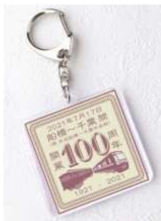
アクリルキーホルダー