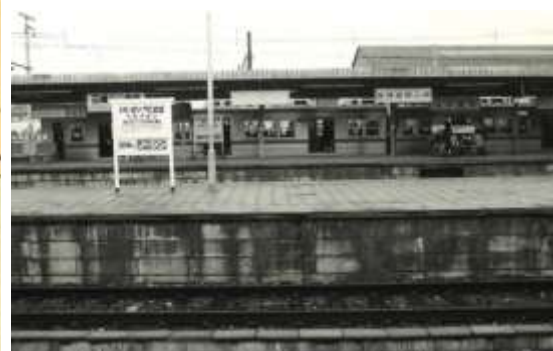
昭和中期の津田沼駅(現 京成津田沼駅)