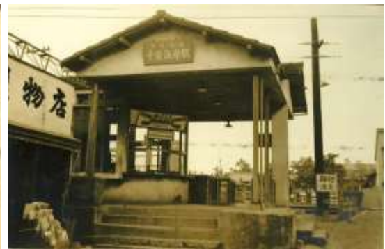
昭和中期の千葉海岸駅(現 西登戸駅)