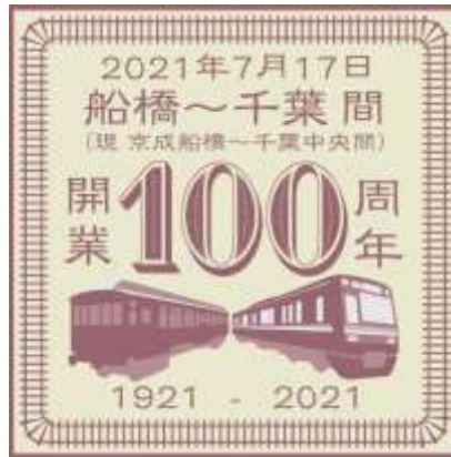
記念ヘッドマークデザイン