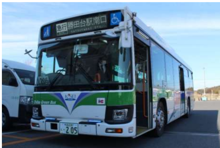
ちばグリーンバス車両

ちばグリーンバスでは、これからも地域に密着した路線網の構築を目指すとともに、安全・安心なバス輸送サービスを提供してまいります。