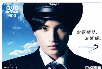
「京成王子オリジナルQUOカード」イメージ