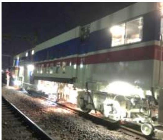
〈線路保守作業の様子〉