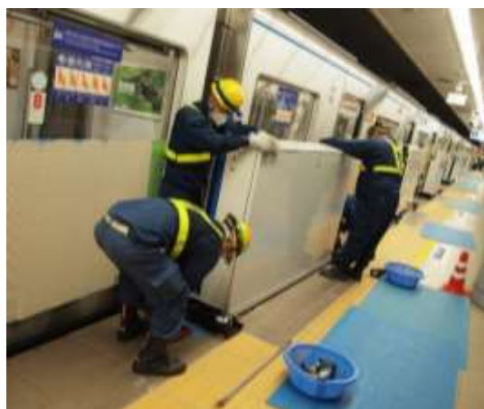
〈ホームドア設置の様子〉