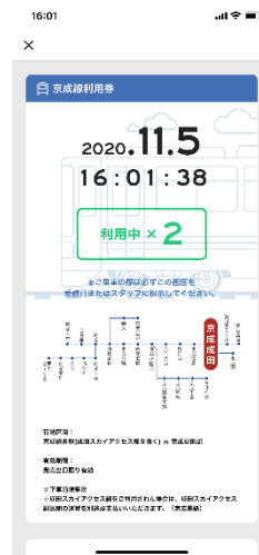
「京成線利用券」 (駅員確認画面)