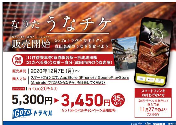
ポスターデザイン