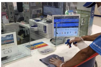
駅窓口の消毒作業

※熱中症予防のため、お客様と近接しない事を確認したうえでマスクを着用しない場合がございます。