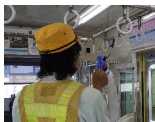
つり革の消毒作業 (通勤車両)