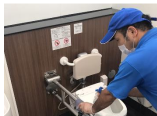
トイレの消毒作業