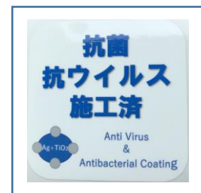
「抗菌・抗ウイルス施工済」ステッカー (鉄道車両内に掲示)

お客様におかれましても、手洗い・うがい・咳エチケットのほか、時差出勤など混雑時間帯を避けたご乗車や、車内換気のため天候や混雑状況に応じた窓上部の開閉等へのご協力、また、可能な限り、マスクの着用と会話の際の周囲へのご配慮をお願い申し上げます。