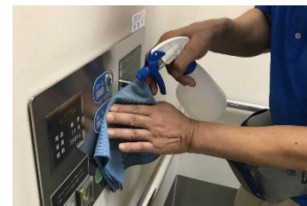
エレベータボタンの消毒作業