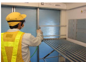
抗菌・抗ウイルス加工作業 (スカイライナー手荷物置き場)