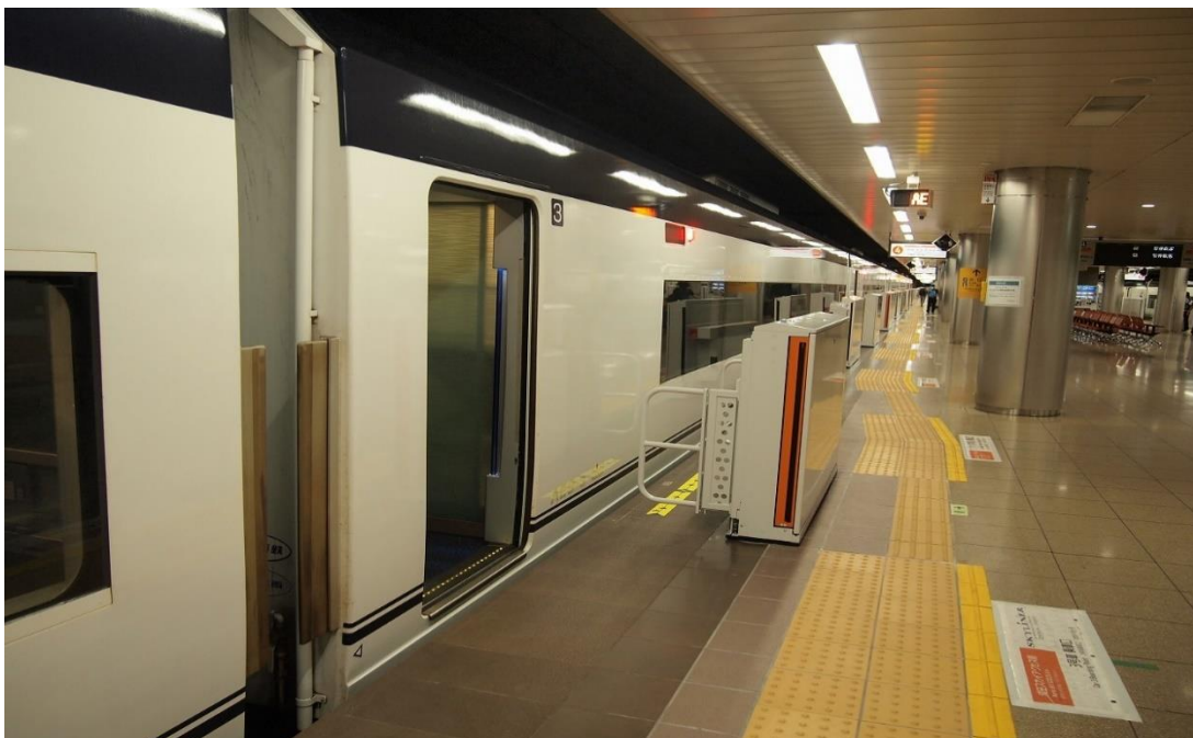
成田空港駅ホームドア