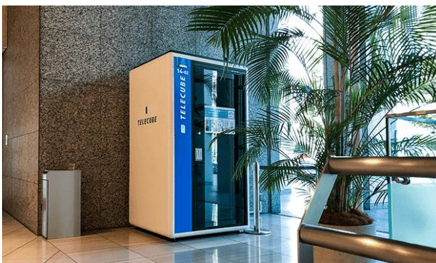
テレキューブ外観(イメージ)