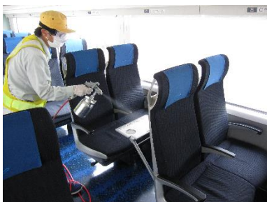
抗菌・抗ウイルス加工作業