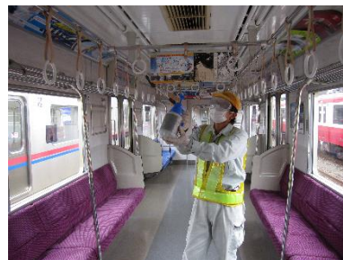
車内つり革の消毒作業