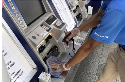
自動券売機の消毒作業

※熱中症予防のため、お客様と近接しない事を確認したうえでマスクを着用しない場合がございます。