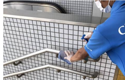
階段手すりの消毒作業