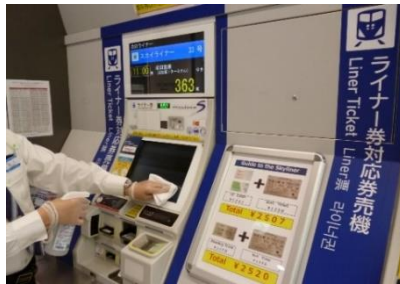
駅構内券売機の消毒作業

駅構内やスカイライナーをはじめとする車両の消毒については、定期に加え必要に応じて実施するとともに、券売機や手すり・つり革等お客様が触れる部分への重点的な消毒を行っています。また、通勤型車両では係員による窓上部の開閉、スカイライナー車両（イブニングライナー・モーニングライナー含む）では換気装置により、車内換気を実施しています。