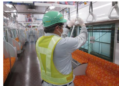
車内つり革の消毒作業

お客様におかれましても、手洗い・うがい・咳エチケットのほか、時差出勤など混雑時間帯を避けたご乗車や、車内換気のため天候や混雑状況に応じた窓上部の開閉等へのご協力、また、可能な限り、マスクの着用と会話の際の周囲へのご配慮をお願い申し上げます。