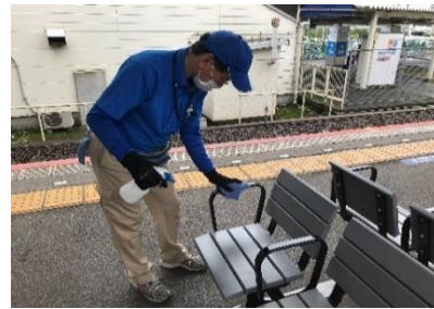
駅ホームベンチの消毒作業