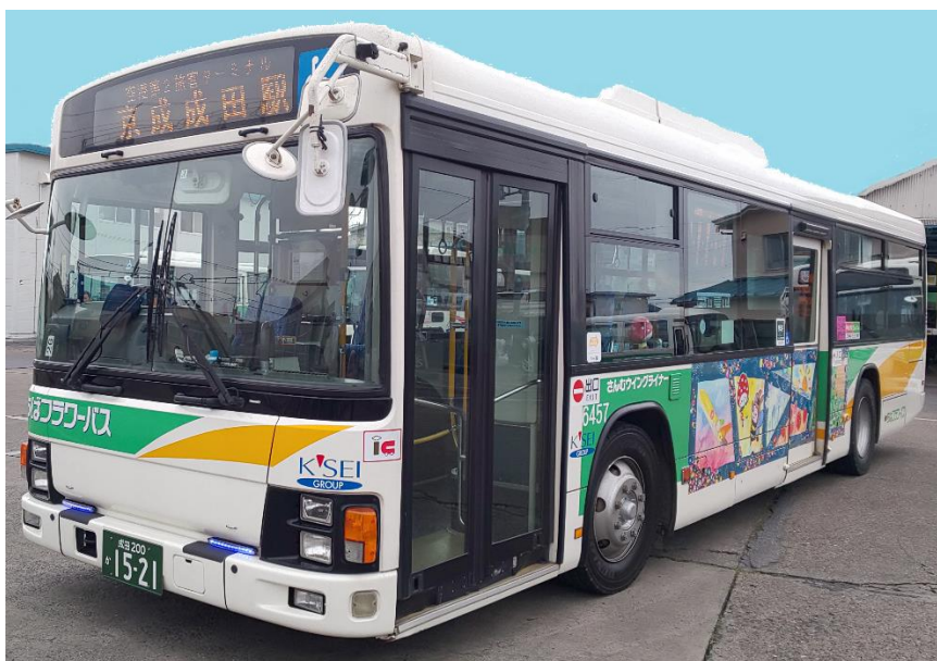
「さんむウイングライナー」で運行しているバス車両

今回のダイヤ改正では、山武市内から成田市内外へ通勤・通学される方もご利用頂けるようにする事を目的として、新たに朝の2便、平日夕方の1便を京成成田駅着・発にします。