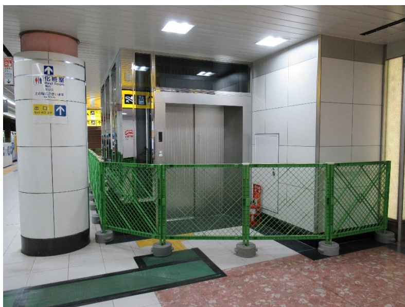
空港第2ビル駅に新設するエレベーター(ホーム階)