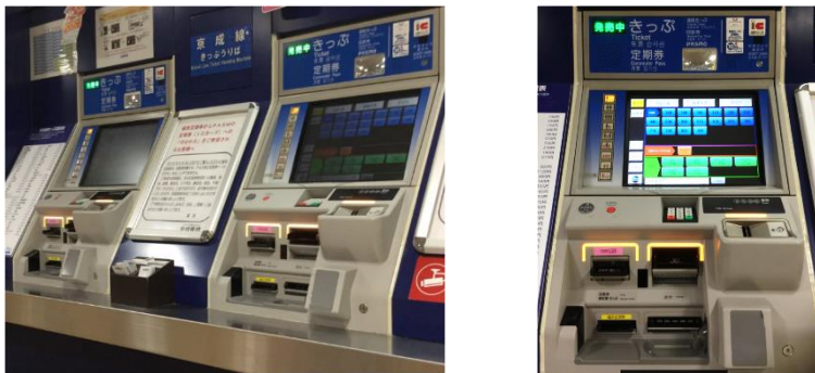
《定期券購入可能な券売機》