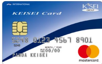
京成カード(オリコ)

貯めたポイントは京成カード加盟店でのお買い物やサービスのご利用、PASMOへのチャージなどにご利用可能です。