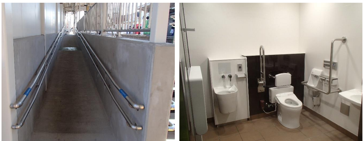
完成後の検見川駅バリアフリー施設(左:スロープ、右:多機能トイレ)