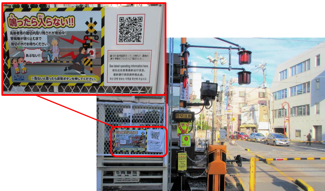
設置例(八幡第1号踏切)