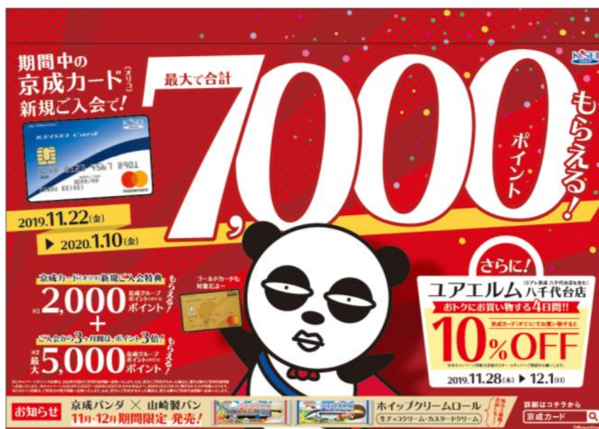
キャンペーンポスター（イメージ）