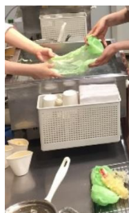
食品サンプル作り(イメージ)