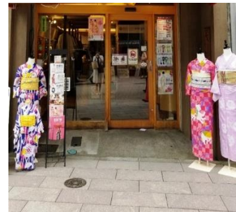
着付け体験(イメージ)

今回発売するコースは『地方競馬体験』と、『食品サンプル作り&着付け体験』の日帰りツアー2コースです。