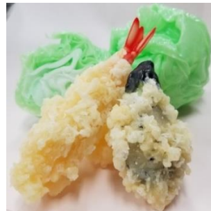
食品サンプル(イメージ)