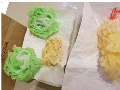
食品サンプル(イメージ)