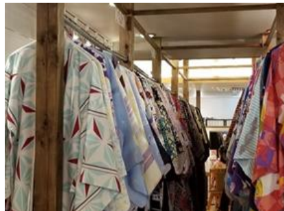
着付け体験(イメージ)