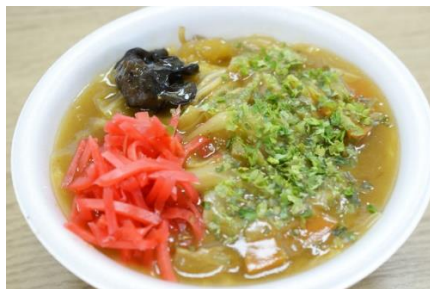
人気のB級グルメ(イメージ)