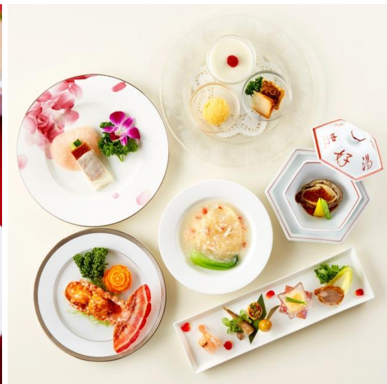
本格中国料理コース

この「本格中国料理コース」は、中国料理の代表的な高級料理として有名な「フカヒレの姿煮」や「北京ダック」をはじめ、「ロブスターのチリソース煮」や「アワビの蒸し物 ブラックビーンズソース」、「中華風牛肉のステーキ」などが並び、お祝い事や接待などのシーンでよくご利用いただける「卓料理10,800円コース」として普段から人気のコースです。