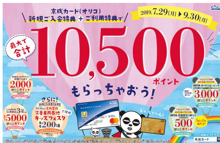
キャンペーンポスター（イメージ）