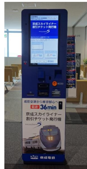
京成スカイライナー 割引チケット発行機