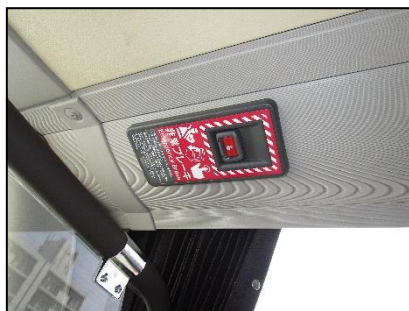
非常ボタン（客席最前部2カ所）