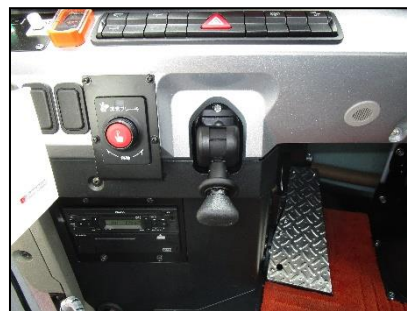
非常ボタン（運転席左側）

このシステムは乗務員に異常が発生した際、運転席左側と客席最前部（2カ所）にある非常ボタンを押すことで車両を緊急停止する安全装置です。システムが作動すると車内外に音と光で警告するとともに、車両が徐々に減速し、周囲に緊急停止を報知します。