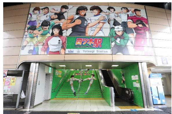
左:記念乗車券イラスト面・券面(イメージ) 右:四ツ木駅特別装飾