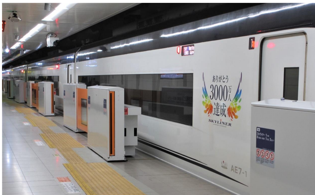
空港第2ビル駅ホームドア