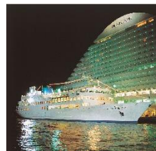
カタログ ギフト 掲載商品 (イメージ)