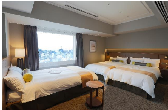
フェスタスイート 寝室