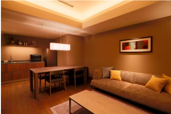
フェスタスイート リビング

フェスタとはイタリア語で「お祭り、パーティ」の意。家族や友人で楽しく贅沢なひとときを過ごして頂くことをコンセプトとした客室。