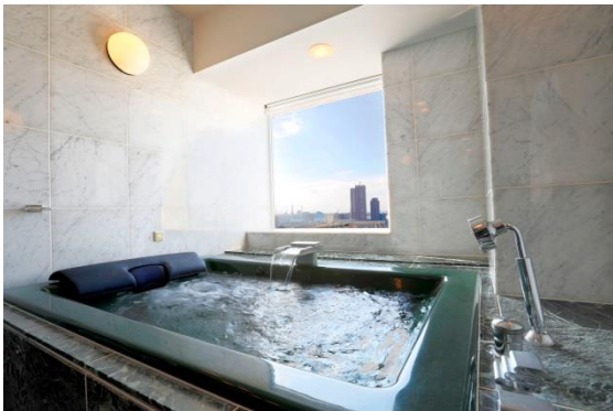
ラグジュアリービューバスツイン バスルーム

景色が眺望できる大きなバスルームを備え、海をイメージしたリラックスできる空間をコンセプトとした客室。