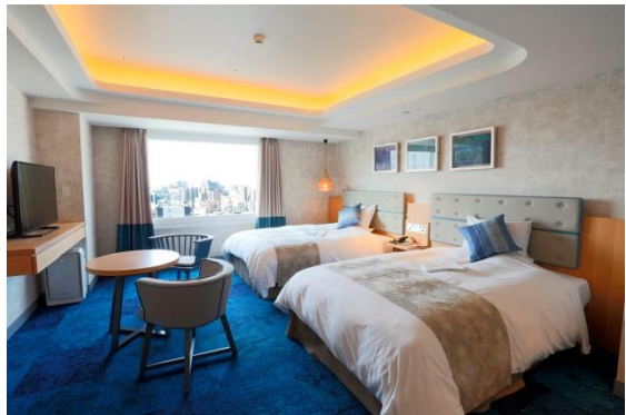
ラグジュアリービューバスツイン 寝室