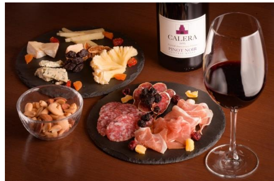
ワインバー ミレフォリア おつまみ