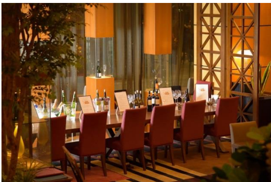
ワインバー ミレフォリア

10種類以上のグラスワイン、ワインとチーズのマリアージュセット、日替わり飲み比べセットなど、上質な空間でゆったりとソムリエ厳選ワインをお楽しみいただけます。