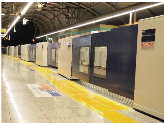
ホームドアイメージ(写真は日暮里駅)