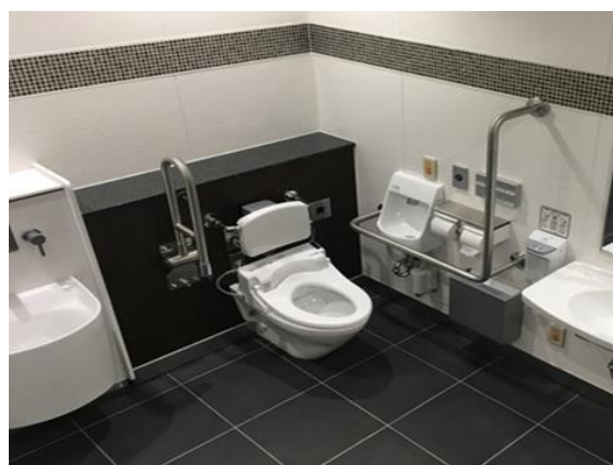
多機能トイレイメージ