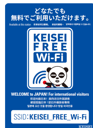
利用可能箇所に掲示するステッカー