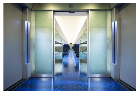
有料特急車両(AE形)デッキ