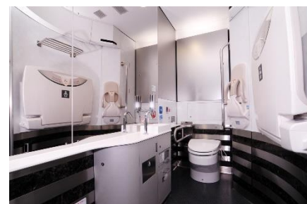
有料特急車両(AE形)多機能トイレ