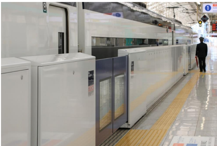
ホームドアイメージ(写真は日暮里駅下りホーム)