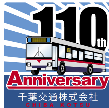
110周年記念ステッカー