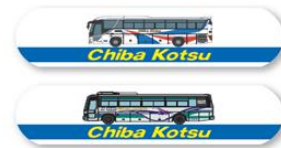
記念グッズ:オリジナル絆創膏