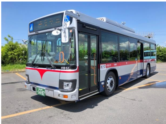
「銀バス」復刻ボディカラーを採り入れた車両(一例)