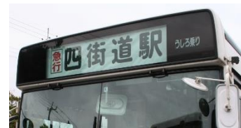
復活する「急行」の方向幕