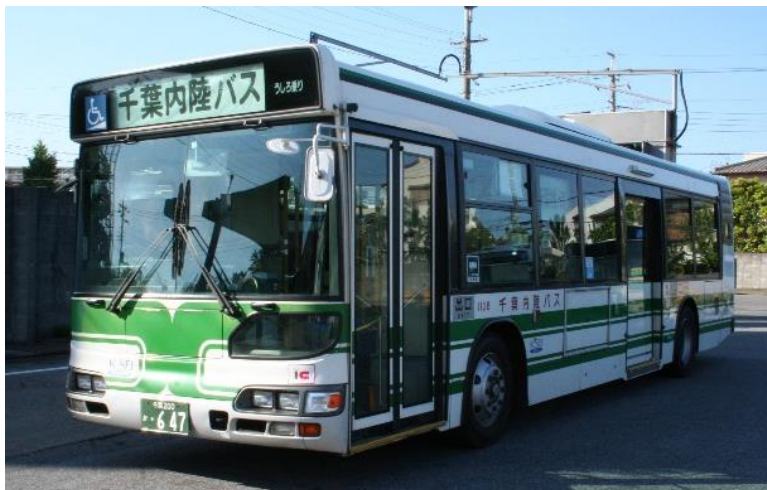
引退予定の当社初のノンステップバス車両1108号車

また、同日午後からは、千代田営業所において「車庫見学会」を開催します(参加無料)。当社バス車両の展示や洗車機体験、高速バスや環境に優しいハイブリッドバスの試乗会等を実施します。