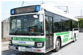
当社初のハイブリッドバス車両

日頃から千葉内陸バスをご利用いただいているお客様や、地域の皆様に、感謝の気持ちをお伝えする目的で開催する復活運行・車庫見学会を是非お楽しみください。