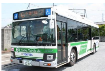
ハイブリッドバス車両