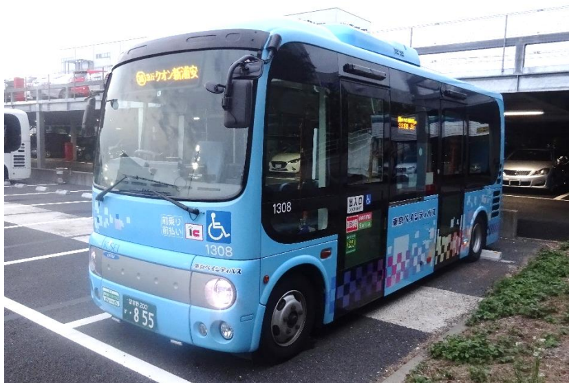
新設路線 38系統「クオン新浦安」行の路線バス