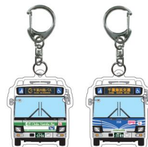
オリジナルキーホルダー(イメージ)

「千葉内陸バス & 千葉海浜交通 夏休み特別企画スタンプラリー」の概要は次頁のとおりです。