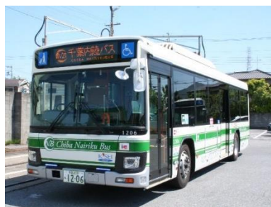
千葉内陸バス路線バス車両(一例)

なお、8月1日(水)からは、千葉内陸バス・千葉海浜交通を含む京成グループのバス14社で使える便利でお得な乗車券「こどもどころパス」がスタンプラリーの際にご利用いただけます。