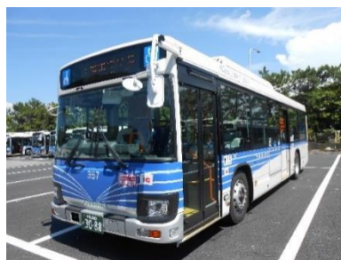
千葉海浜交通路線バス車両(一例)