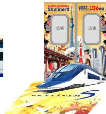
上:車体ラッピングイメージ、 下左:車内窓上イメージ、下右:ドア・床イメージ