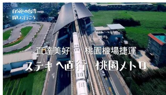
上:スカイライナーラッピングイメージ、下:スカイライナービジョン用動画イメージ