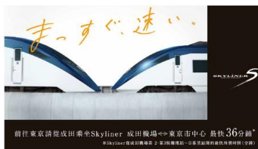
左・中央:京成グループ運行情報ディスプレイ上で掲出する広告、 右:桃園メトロ内で掲出する広告