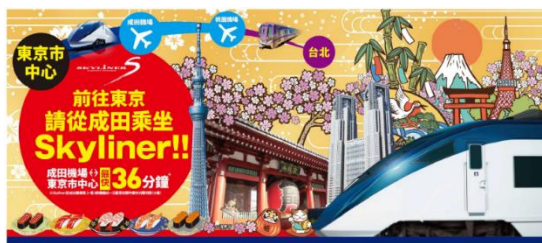
左:京成上野駅看板イメージ、右:台北駅ホームドア看板イメージ