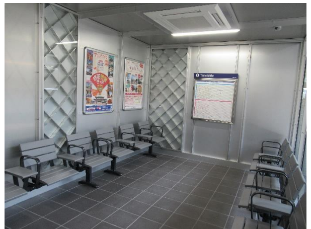
(写真左:待合室の外観、写真右:待合室の内観)